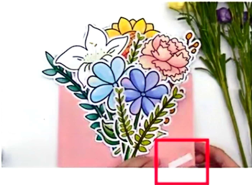
7.如图位置粘贴双面胶