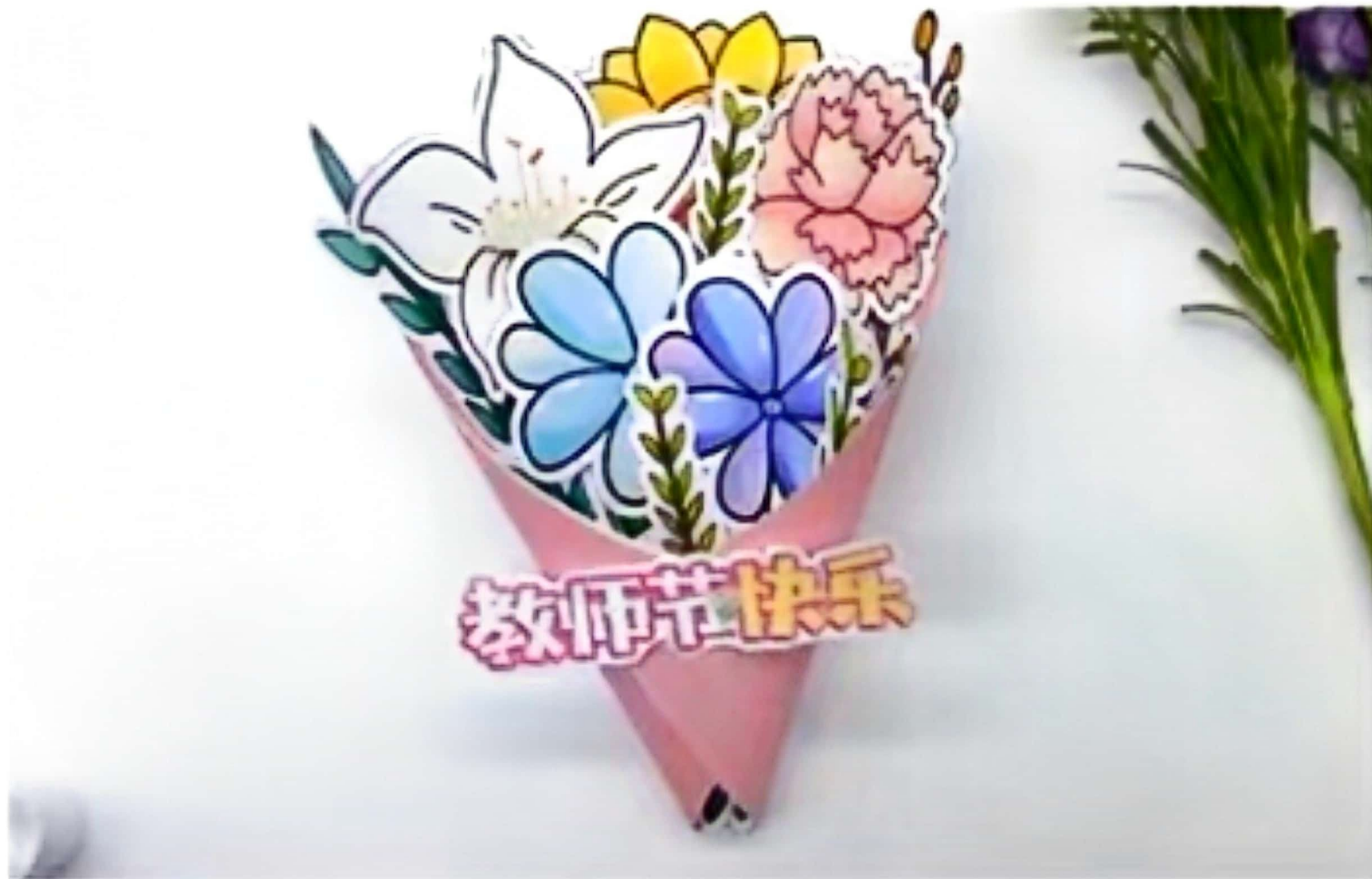
9.贴上文字，花束完成